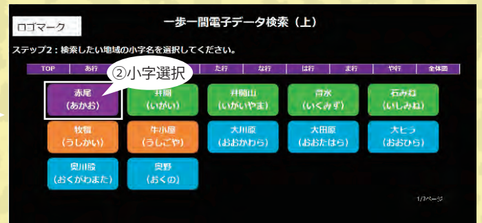
検索システム画面2